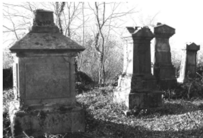
Vue de l'ancien cimetière de Doische actuellement en projet d'aménagement en cimetière cinéraire.

Le décret incite également à la réaffectation de cimetières abandonnés en cimetières cinéraires, qui accueillent tous les modes de sépulture liés à l'incinération, ou en parcs mémoriels, espaces de détente ou de méditation où sont conservés et mis en valeur les éléments de l'ancien champ funéraire.