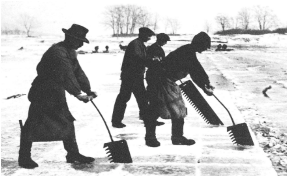
La découpe manuelle de la glace en 1912

Cette année, QVW a choisi de vous faire découvrir le village d'Erezée et par là même souligner les actions et démarches entreprises par le Royal Syndicat d'Initiative d'Erezée (Province de Luxembourg). Favorablement situé sur une colline dominant l'Aisne et l'Estinale, Erezée est blotti au centre d'une région forestière et rurale et constitue un centre de villégiature idéal au sein d'une Ardenne riche en horizons mouvementés. Le Syndicat d'Initiative y propose 220 km de circuits balisés (pédestres et VTT).