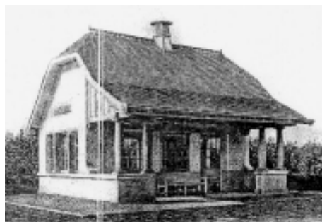
De Haan aan Zee, abri de tram

au Golf-Club de De Haan aan Zee (Le Coq sur Mer), aujourd'hui disparu.