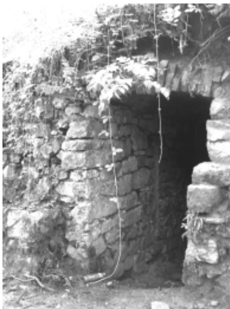
Entrée de la glacière

mations sur son fonctionnement et ses caractéristiques, et un second sur les chauves-souris puisque, par chance, une colonie s'est établie à l'intérieur de la glacière. Le but est, bien entendu, de protéger ces chauves-souris en effectuant les travaux durant la période où elles désertent l'abri et en réalisant quelques petits aménagements afin de conserver leur présence.