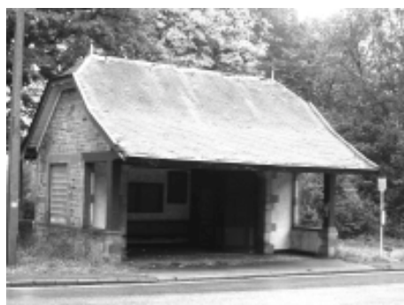
Spa-Balmoral, pavillon en briques

Outre certaines différences architectoniques, les principaux éléments en plan et en élévation sont similaires : volumétrie de la toiture (les coyaux au-dessus de la partie de l'auvent, les croupettes aux extrémités du faite et les petits épis en zinc), position des colonnes d'angle en bois sur murets bas, emplacement des fenêtres, soubassement en saillie et dépassant de toiture. Ces éléments permettent l'attribution à Hobé de l'édicule spadois que vient confirmer la signature de l'architecte.