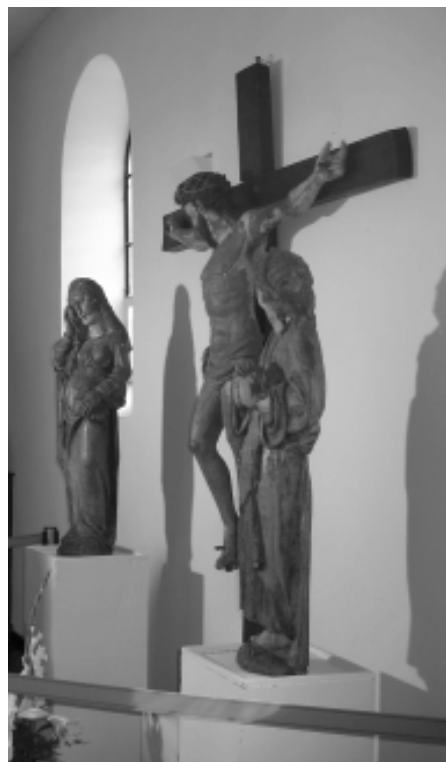
Le calvaire de Bienne-Lez-Happart restauré.