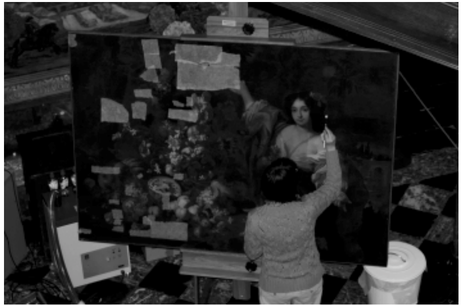
Atelier Artbee, conservation-restauration d'oeuvres d'art

Un couple, restaurateur - créateur de luminaires a illustré son activité en travaillant sur un lustre en cristal dépareillé d'une des pièces du château.