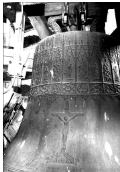
Cloche du carillon de la cathédrale St Aubin à Namur ©Tchorski.

Saisir l'âme des cloches n'est pas chose aisée car elles sont plus