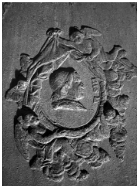
Médaille de Pie IX, bourdon du carillon de la cathédrale de Liège ©Tchorski.

Ces cloches, ces carillons et ces horloges font partie de notre patrimoine qui dans ce cas s'appelle : patrimoine campanaire (campana = cloche en latin). La Région Wallonne a bien compris qu'il faut le remettre en évidence. C'est ainsi que le Ministre Wallon du Patrimoine a décidé d'élargir le champ d'octroi de subsides pour restaurer et mettre en valeur ces éléments essentiels de notre mémoire col-