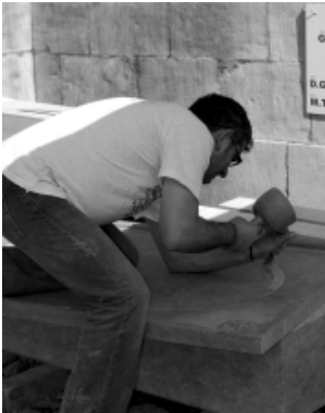
Tailleur de pierres Grillot et cie

Installés dans la cour centrale du château, abrités sous des tonnelles et équipés de leurs outils un tailleur de pierre et une artiste sculpteur de pierre, nous ont initiés à la matière « pierre » et aux multiples techniques utilisées pour son façonnage.