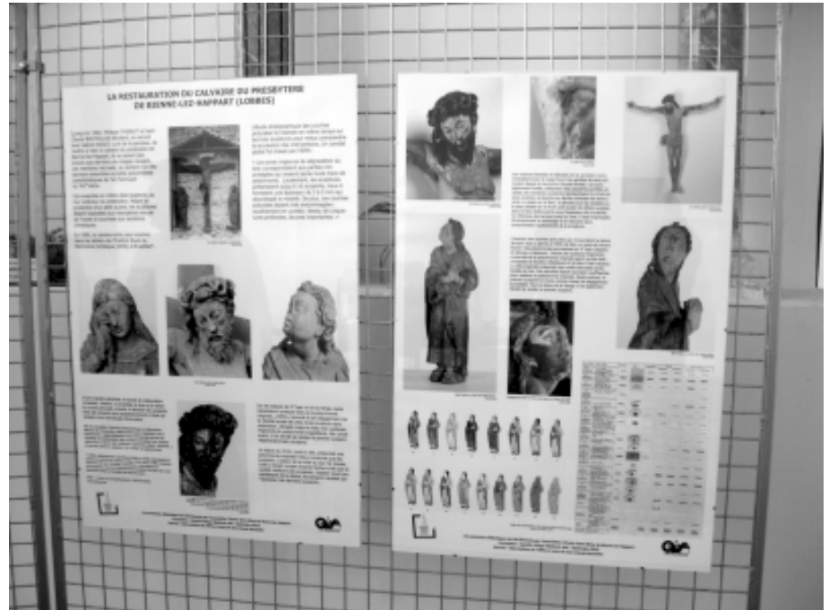
Panneaux sur la restauration, mis en page par QVW.

restauration du calvaire de Bienne-lez-Happart. Une chouette activité !