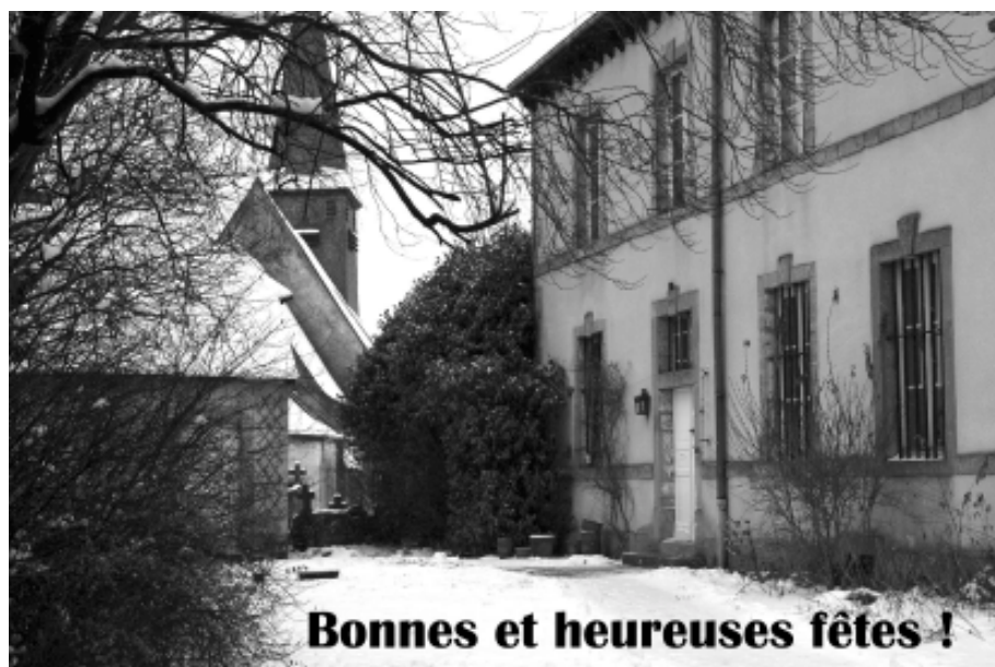
Gérouville, presbytere sous la neige