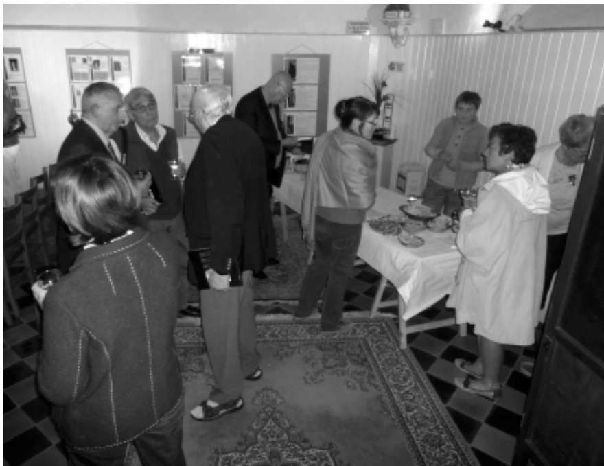
Inauguration de l'exposition et présentation de la brochure à la chapelle de Mont

Par ailleurs, le visiteur a eu la chance de pouvoir accéder à certains décors de l'aile des 4 saisons normalement non visitable et de pouvoir brasser d'un seul regard et de façon inédite plusieurs œuvres de notre artiste. Encore un grand MERCI pour la qualité des recherches et pour ce tour de force.