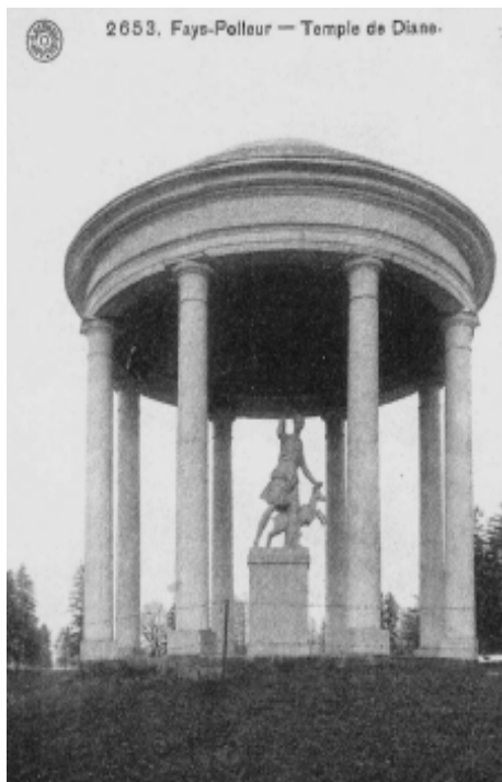
Le temple de Diane avant démolition

Vous souvenez-vous de la récolte de Fonds QVW initiée par le syndicat d'initiative de Polleur pour la reconstitution de l'ancien temple d'Artémis (Diane) autrefois situé à l'orée du parc du château de Fays et démoli inutilement en 1975 lors de travaux préparatoires de construction de l'autoroute Verriers-Spa ?