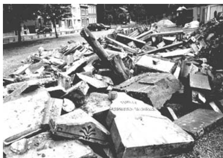
Débris des sépultures et du mur d'enceinte

Suite à des travaux de restauration, une partie du mur d'enceinte du cimetière s'effondre, entraînant dans sa chute des sépultures. Le chef des travaux reçoit l'ordre de supprimer l'ensemble des tombes qui gisent sur l'espace public. Les villageois réagissent et, conseillés par François Braibant, journaliste à la RTBF, prennent contact avec QVW.