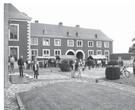
J.P.2007 au château d'Aigremont

Donner la possibilité à des personnes de s'investir dans le respect de leur espace vital, leur proposer des actions participatives de sensibilisation et de construction dans leur village est une des force motrice du comité QVA