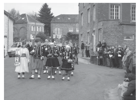
Les zouaves et les deux cantinières débouchent sur la place de Fraire

Depuis 2004, les projets menés par le comité Waudrez mieux ont pour but de sensibiliser les habitants du village au caractère rural que conserve le village. Les membres sont très sensibles aux activités qui touchent à l'environnement et à la vie associative.