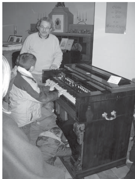
Les élèves de la commune n'ont