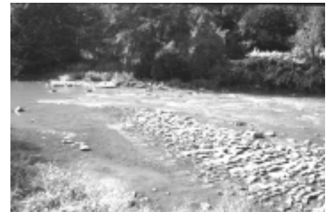
Gué pavé Becoën Souquenry

encore le gué classé de Becoën-Souquenry près de Pepinster (prov. de Liège).