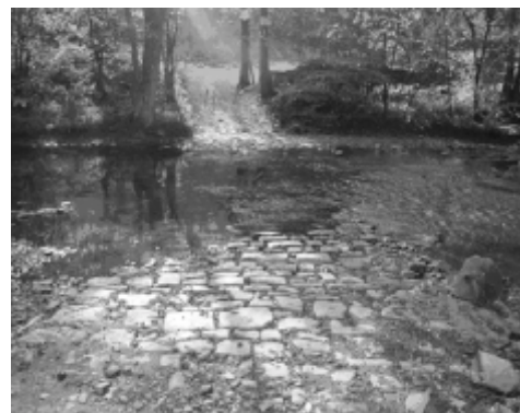
Gué pavé à Jusaine (Durbuy) sur l'Aisne

Quant à vous, n'hésitez pas à nous envoyer toutes informations susceptibles d'enrichir nos connaissances à ce sujet ou de nous signaler l'existence de l'un ou l'autre gué près de chez vous.