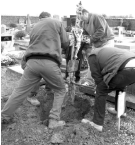
Transport des croix

Un conservatoire des croix de fonte est né à Mesvin (Mons, Prov. de Hainaut)