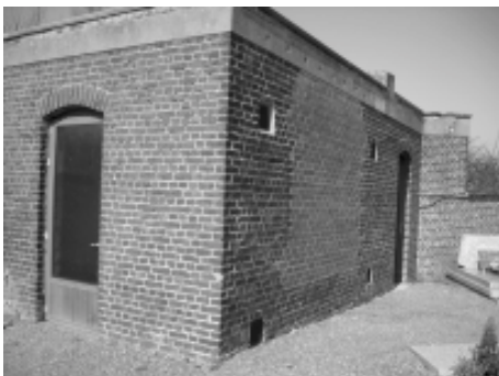
Morgue avant travaux

Sensibilisées par QVW à ce petit patrimoine artistique et industriel, la Ville de Mons et l'association « Mesvin Patrimoine » ont travaillé ensemble à la réalisation d'un conservatoire composé de huit croix de fonte présentées autour de l'ancienne morgue du cimetière local. Ces 24 et 25 septembre 2011, le conservatoire a été inauguré et a fait l'objet de visites guidées destinées aux habitants.