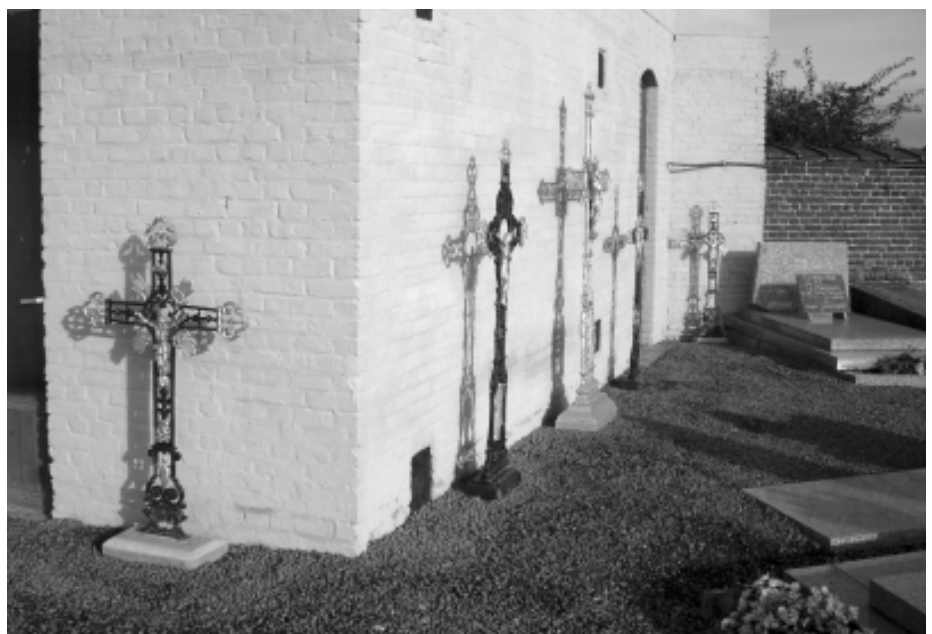
Le conservatoire finalisé.

Gageons maintenant que l'association puisse convaincre la Ville de Mons qu'une réaffectation intérieure de l'ancienne morgue est possible et souhaitable.