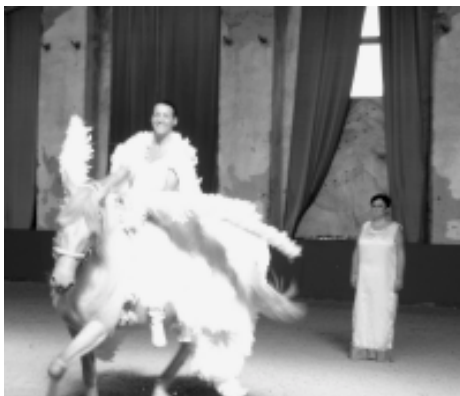
Spectacle dans l'ancien bâtiment des compresseurs du charbonnage du Levant-produits de Cuesmes.

Pour le « Comité Lampe de mineur » et Qualité-Village-Wallonie, le travail continue. Les Journées du Patrimoine étaient en effet une première étape dans la remise en valeur de la Lampe. Celle-ci devrait aboutir à la restauration de l'élément et, dans cet objectif, des démarches sont encore à faire.