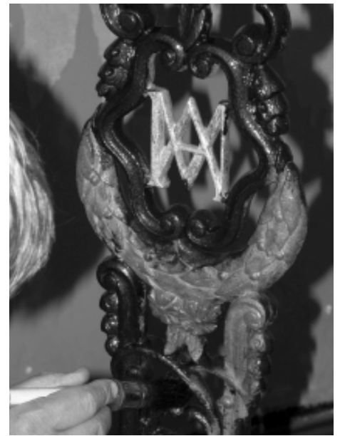
Mise en peinture d'une croix

L'association a procédé à la restauration manuelle des croix dans un local mis à sa disposition par la Ville de Mons (cure désaffectée). Chaque bénévole, responsable d'une croix, s'est attelé à la tâche, à son rythme.